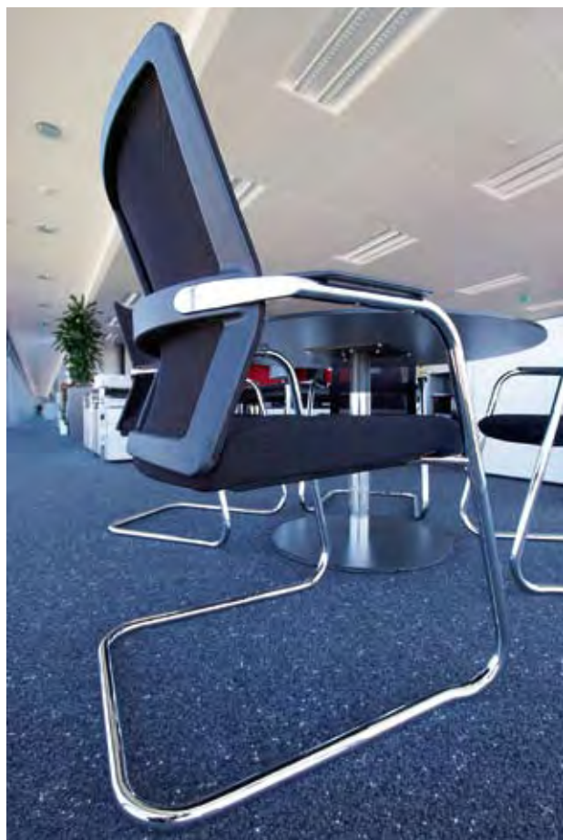
FREISCHWINGER: Besucherstühle der Modellreihe Rovo XN.

Auch vom Design her fügen sich die Modelle harmonisch in die transparente Architektur des Gebäudes ein, nicht zuletzt aufgrund des Rückenlehnen-Rahmens mit textiler Netzbespannung. Die Gestelle aus poliertem Aluminium beziehungsweise Chrom passen gut zu den verchromten Schreibtischgestellen und das offene Stuhl-design harmoniert gut mit dem schlanken Design der Büromöbel. Nach der gelungenen Ausstattung des Kundenservice-Centers in Loßburg sollen in Zukunft auch in den verschiedenen internationalen Niederlassungen von Arburg weitere Stuhlmodelle von Rovo Chair zum Einsatz kommen. (dam) ■