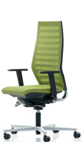
R12 6060 EB