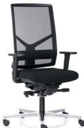
R14 3060 EB