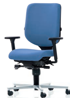
XT 3020 EB PLUS