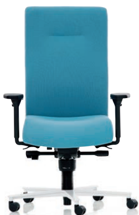
XP 4020 EB PLUS