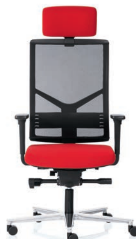
R14 3070 EB