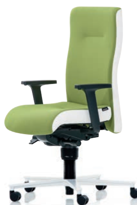
XP 4015 EB PLUS