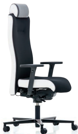
XP 4030 EB