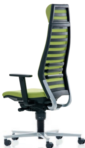
R12 6070 EB PLUS