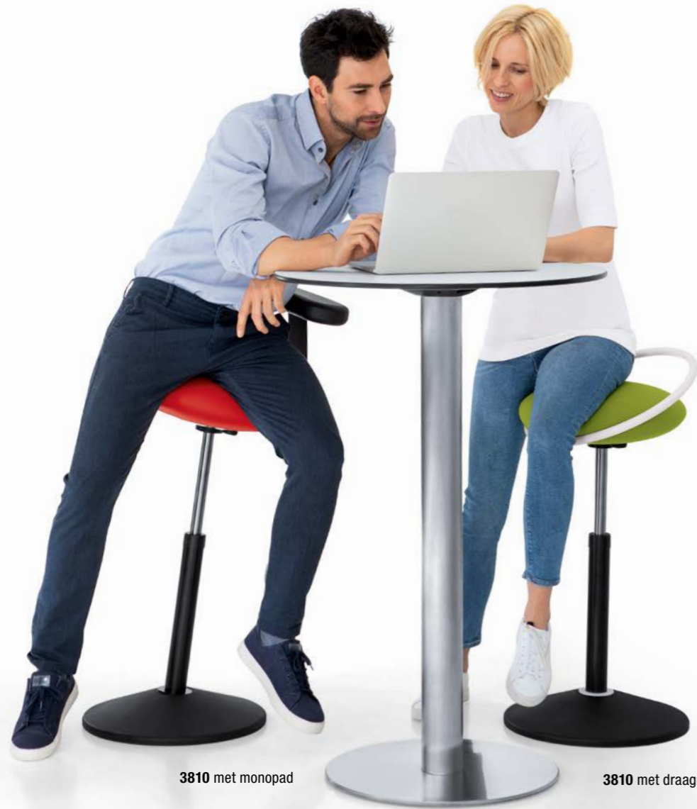
3810 met monopad