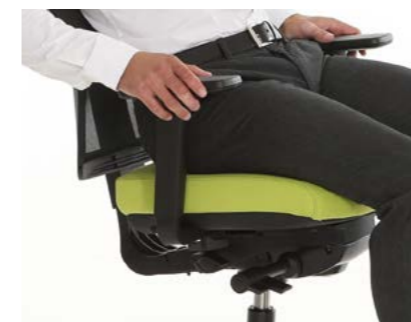
ERGO BALANCE TECHNIK: Sie erlaubt eine dreidimensionale Bewegung des Anwenders.