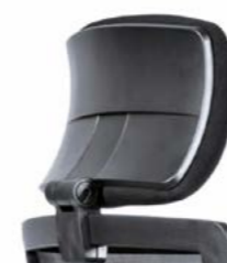
KOPFSTÜTZE: Höhenverstellbar und neigbar (optional erhältlich).