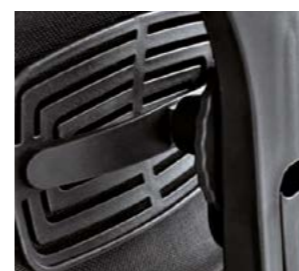
LORDOSENSTÜTZE: Höhenverstellbar und tiefenverstellbar unterstützt sie den unteren Teil des Rückens.