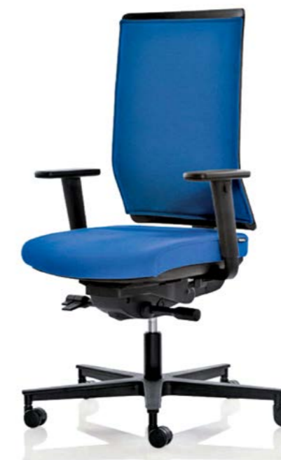
POLSTERRÜCKENVERSION: Hier wurde auf das Netz ein gepolstertes Kissen aufgenäht.